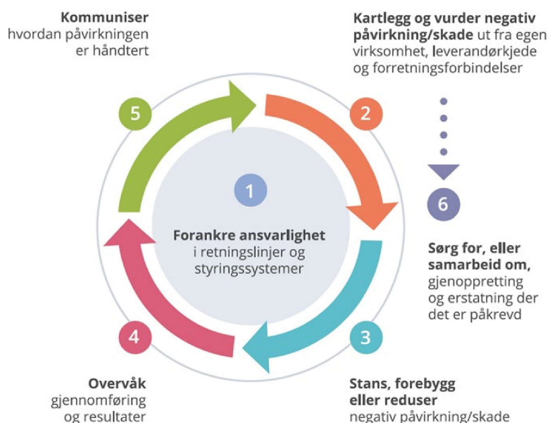
Figur: OECDs kontaktpunkt

Aktsomhetsvurderinger utføres i tråd med OECDs retningslinjer for flernasjonale selskaper, som innebærer en 6-stepsprosess.