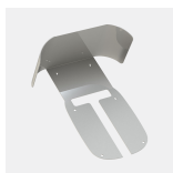
711010 - eRange Acc | IQ roof wall